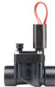
PGV-100G Priemer závitů: 1" (25 mm) Výška: 13 cm Dĺžka: 11 cm Šírka: 6 cm