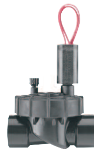
PGV-100JT - G Priemer závitů: 1" (25 mm) Výška: 14 cm Dĺžka: 11 cm Šírka: 8 cm