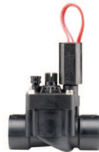
PGV-101G Priemer závitů: 1" (25 mm) Výška: 13 cm Dĺžka: 11 cm Šírka: 6 cm